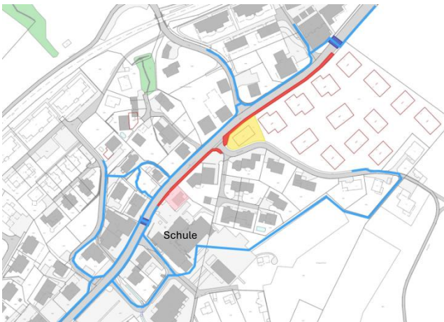
Etappe 2: Donnerstag 24.10.2024