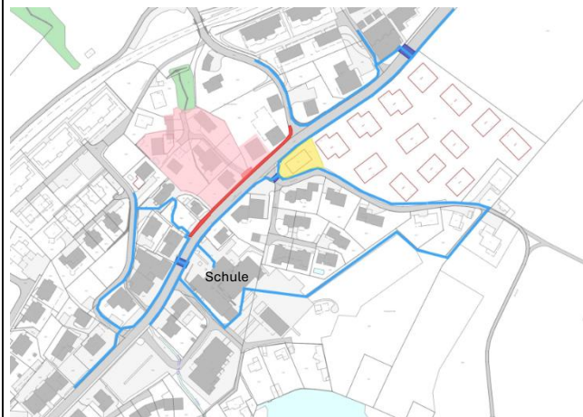
Etappe 1: Mittwoch 29.10.2024